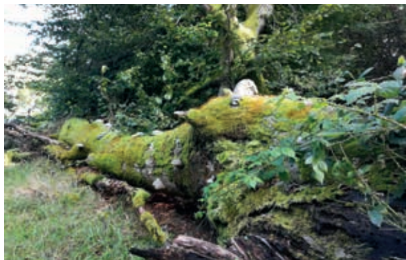
Urørt skov i Trolde-skoven 7

Skoven har også fine partier med de oprindelige op til 300 år gamle bøgeskove. De mest kendte er Trolde-skoven 7 i Rebild Bakker og Bjergeskov ved Frueskøen 9 . Træerne er flerstammede, krogede og knortede – det der her på egnen kaldes "purker". Formen skyldes en kombination af hyppig nedhugning (stævning), svampeangreb, bid af vildt og kreaturer samt frost og vind. Disse bøgeskove har siden 1992 været udlagt som urørt skov uden fældning eller anden skovdrift. Siden er arealet med urørt skov blevet væsentligt udvidet og udgør i dag ca. 1250 ha. Det omfatter arealerne vest og nord for St. Økssø, Rebild Bakker, Gravlev Ådal og mod nord Nørreskoven og Bjergeskoven. Formålet er at fremme biodiversiteten, så der er plads til flest mulige arter. Her i Rold Skov betyder det, at de ikke hjemmehørende nordamerikanske nåletræer langsomt vil blive fjernet til fordel for de naturlige hjemmehørende løvtræer og at der vil komme flere lysninger i skoven, hvor der afgræsses med kvæg. Se mere her vilderenatur.dk