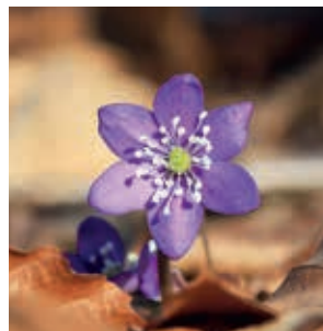
Blå Anemone i Bjergeskoven