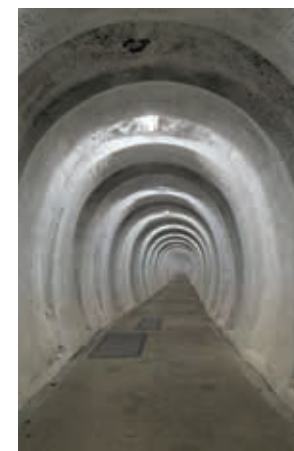
Indgangstunnel REGAN Vest

Da Hobro-Aalborg vejen i 1970'erne blev etableret, var det nødvendigt at føre Lindensborg Å igennem den høje vej-dæmning i et stort betonrør. På Gravlev Ådal Ruten kan man nu passere tunnelen ad den 76 m lange hængebro. En helt særlig måde at opleve åen på! Lidt den samme fornemmelse som de besøgende på Koldkrigsmuseet REGAN Vest oplever, når de på guidede ture bevæger sig igennem den lange indgangstunnel ind til det underjordiske bunkeranlæg.