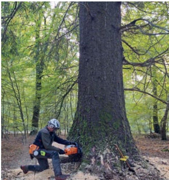
Fældning af stor sitkagran i urørt skov