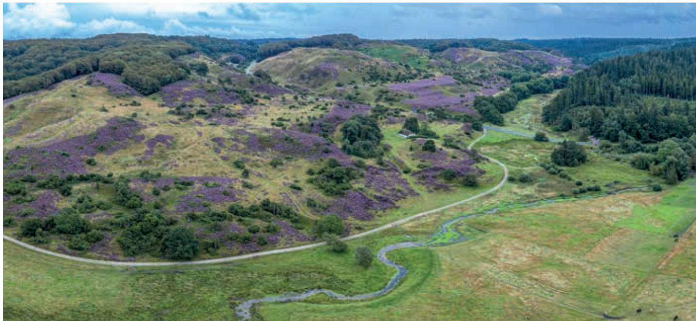
Rebild Bakker med hulvejen, Kovadsbækken 1 og Lars Kjærs hus 6